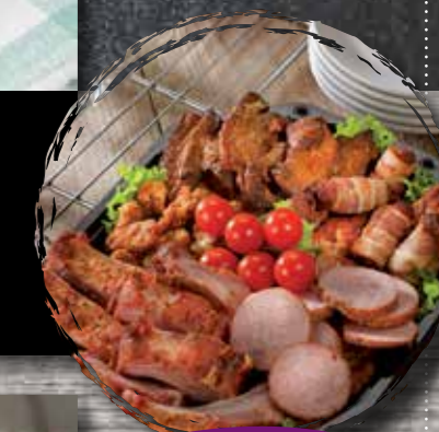
Lekkere grill snacks

Hartige snacks voor 's avonds bij de borrel