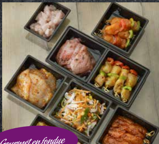
Gourmet en fondue

Uw Poelier is dé specialist in de lekkerste wildspecialiteiten. Een goede combinatie dus. Wij hebben voor de komende feestdagen als vanouds weer een uitgebreid assortiment wild. Laat u verrassen door de ruime keuze en natuurlijk krijgt u van ons het juiste advies voor de lekkerste bereiding.